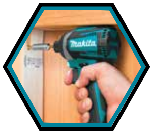
Ideal für die Arbeit an engen Stellen.

Leerlaufdrehzahl : 0 - 1'100 / 2'100 / 3'600 U/min Leerlaufschlagzahl : 0 - 1'100 / 2'600 / 3'800 Schläge/min Aufnahme : 1/4" Drehmoment hart : 175 Nm Gewicht mit Akku : 1,6 kg