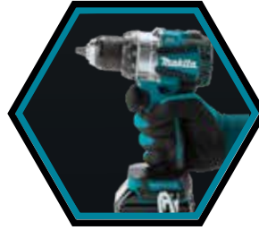
Kompakte und ergonomische Maschine.

Geliefert mit 2x Akkus 5.0 Ah, Schnellladegerät und Makpac-B Transportkoffer