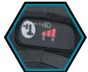
3 verschiedene Drehzahleinstellungen.