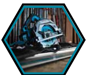
Passet ohne Adapter auf Führungsschiene.

Durchmesser Sägeblatt : 190 mm Leerlaufdrehzahl : 6'000 U/min Max. Schnittleistung 90°/48°/45° : 62,5/41/44,5 mm Maximale Leistung : 1'300 W Gewicht mit Akku : 3,7 kg