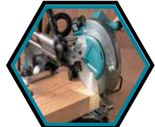
Ein LED-Licht wirft eine Schattenlinie vom Sägeblatt.

Durchmesser Sägeblatt : 260 mm Leerlaufdrehzahl : 3'600 U/min Max. Schnittleistung 90° : 91 x 279 / 68 x 310 mm Schrägschnitt bei 45° L : 58 x 279 / 42 x 310 mm Coupe inclinée 45° D : 43 x 279 / 29 x 305 mm Max. Neigungswinkel R : 48 / 48° Maximale Leistung : 1'600 W Gewicht mit Akku : 25,1 kg